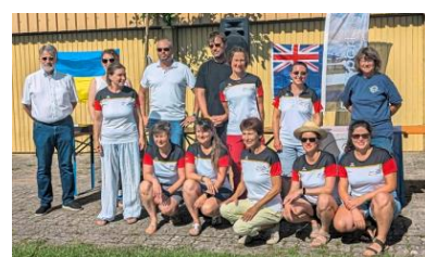
Die Pilotinnen der neuen Frauen-Nationalmannschaft

https://sportdeutschland.tv/deutscheraeroclub/segelfliegen-frauen-deutsche-meisterschaft-stream-2