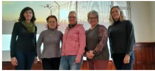
Das Orgateam der Fortbildungsveranstaltung

Der LSV Thüringen hat insgesamt drei Veranstaltungen für die Frauen in der Luftfahrt durchgeführt: