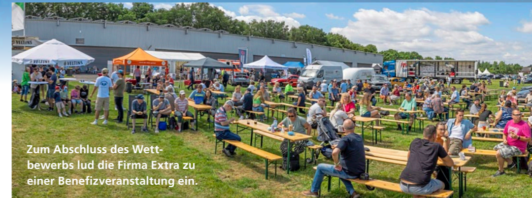
Zum Abschluss des Wettbewerbs lud die Firma Extra zu einer Benefizveranstaltung ein.