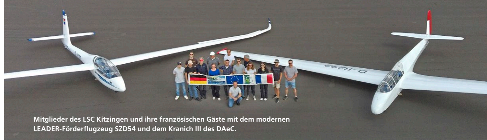
Mitglieder des LSC Kitzingen und ihre französischen Gäste mit dem modernen LEADER-Förderflugzeug SZD54 und dem Kranich III des DAeC.