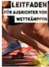
Leitfaden für Ausrichter