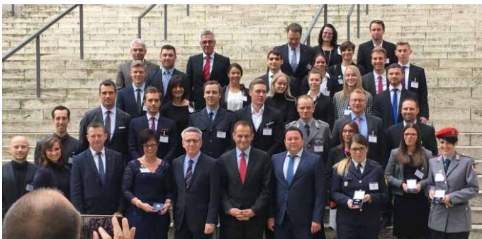
Insgesamt 44 Spitzensportler erhielten im Bundesinnenministerium das Silberne Lorbeerblatt aus den Händen von Thomas de Maizière.