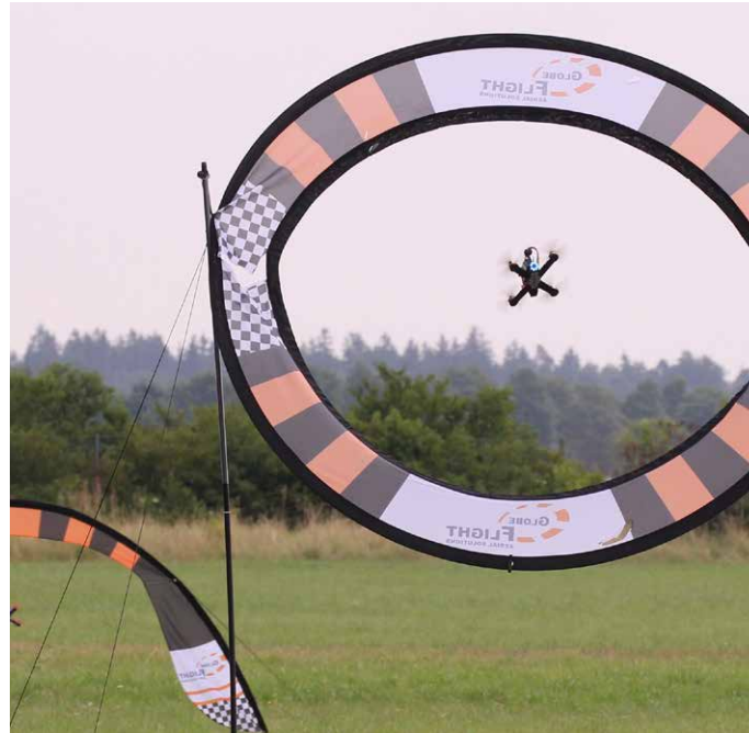
Der Drohnensport gewinnt auch in Deutschland immer mehr an Bedeutung.

Beim ersten F3U-World-Cup in Deutschland konnte in diesem Jahr in Bitterfeld bereits die Nationalmannschaft für die Weltmeisterschaft ermittelt werden: Wenn im November 2018 in