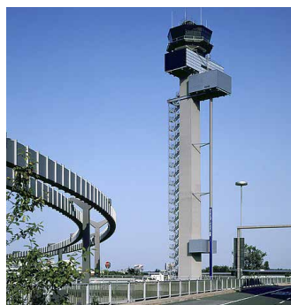
DFS Tower in Düsseldorf.

Beim vorausgegangenen Luftraumabstimmungsgespräch am 18. Oktober in