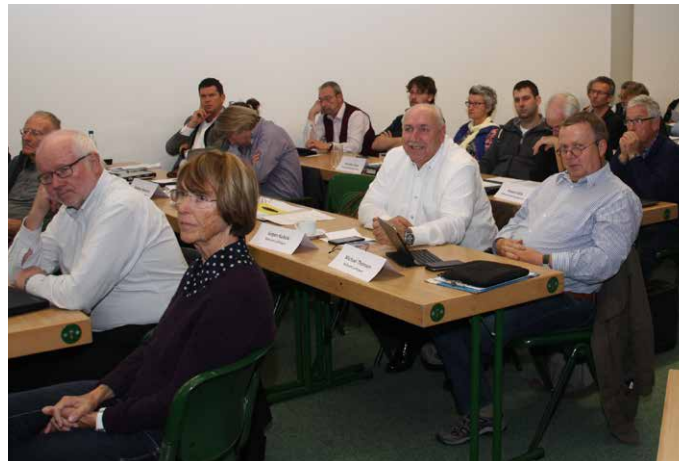
Die Mitgliederversammlung dauerte bis zum Abend.