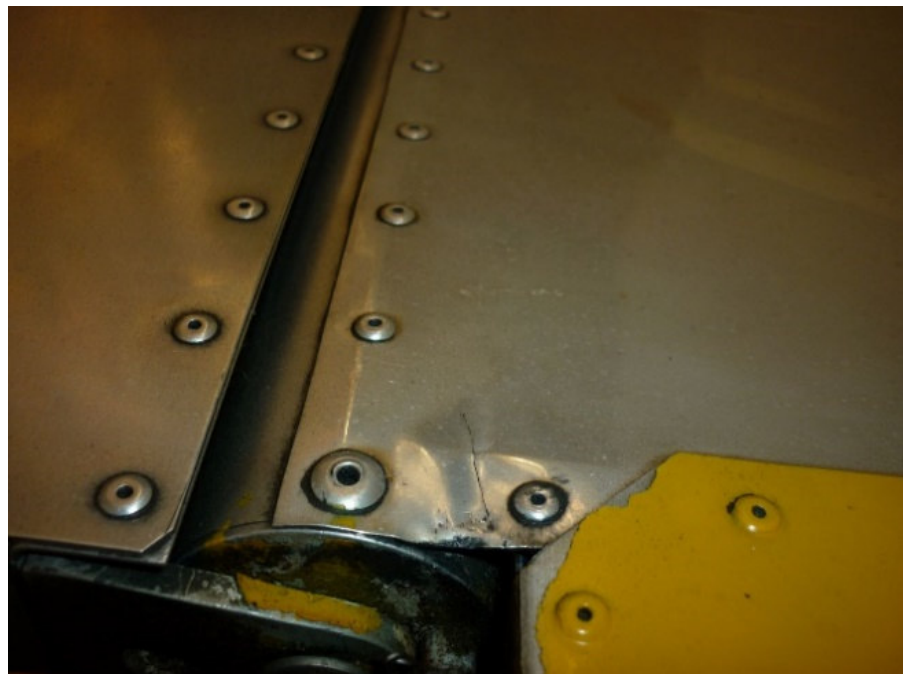
Abbildung 1: Knicke, Falten