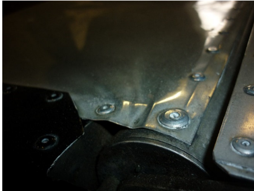
Abbildung 2: Falten, Risse