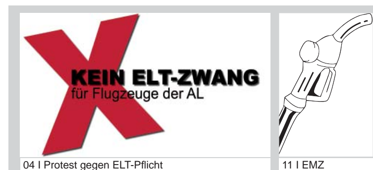
04 | Protest gegen ELT-Pflicht

Die Dopingkontrollen bei deutschen Luftsportlern waren ausnahmslos negativ.