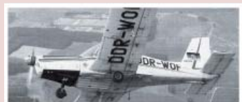
11 | 20 Jahre Mauerfall