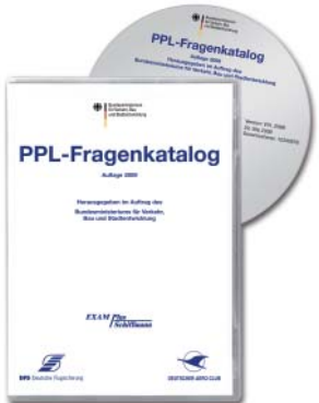
08 | PPL-Fragenkatalog

Der DAeC hat den Entwurf zur Änderung der Luftverkehrsordnung und anderer luftrechtlicher Vorschriften vom BMVBS fristgerecht kommentiert und seine Änderungswünsche eingereicht.