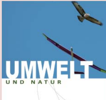
04 | Flugblätter

In der Rubrik „Termine“ unter www.daec.de sind Termine von Flugplatzfesten und Fly-ins, nationalen und internationalen Wettbewerben, Lehrgängen und Fortbildungen, Messen und Kongressen aufgeführt. Alle Veranstaltungen mit den Kontaktadressen sind mit Hilfe der Suchkriterien leicht zu finden. Der Eintrag ist für Mitgliedsvereine kostenlos.