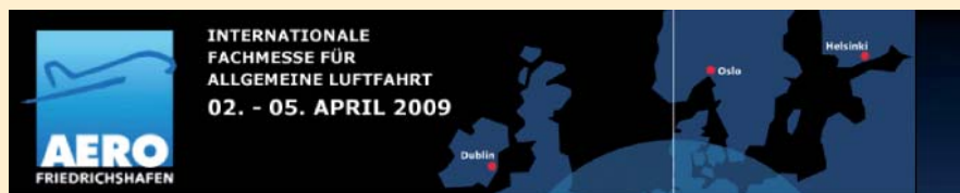
04 | AERO 2009