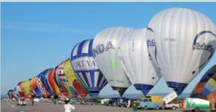
08 | Weltrekord