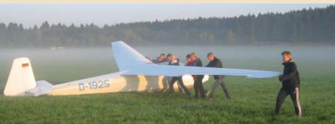
09 | Bundesjugendvergleichsfliegen