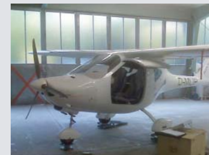
11 | Musterzulassung Speed Cruiser