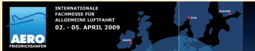
04 | AERO 2009