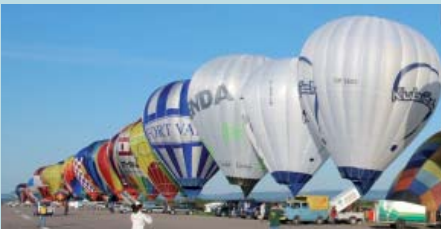
08 | Weltrekord