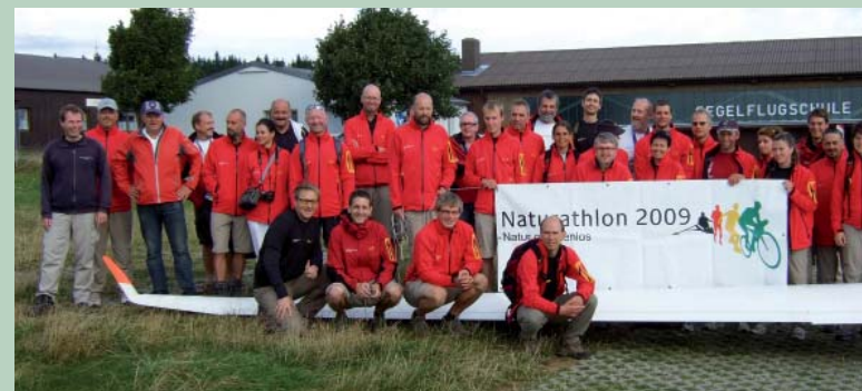
08 | Naturathlon 2009

Ende 2009 lief die Übergangsregelung der Landeplatz-Lärmschutzverordnung (LLV) für Flugzeuge mit Baujahr vor 2000 aus. Dann müssen auch diese Flugzeuge eine zusätzliche Lärminderung um rund zwei db(A) nachweisen können, damit sie das Zeugnis für erhöhten Lärmschutz be- oder erhalten können. Der DAeC hatte sich mit Partnern für eine luftsportfreundliche Regelung eingesetzt, bislang aber konnte eine bessere Lösung nicht erreicht werden.