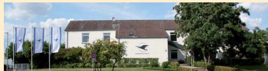
09 | Standortvorteil