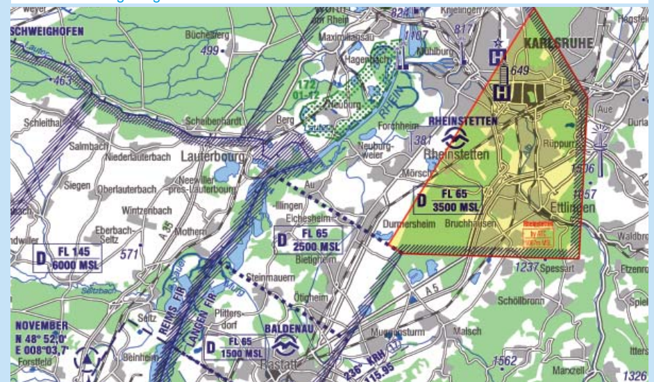
03 | Sektorenregelungen: Karlsruhe

Zu Jahresbeginn wurden umfangreichen Luftraumänderungen eingeführt. In den meisten Räumen konnten die zwischen der Deutschen Flugsicherung, dem DAeC-Ausschuss Unterer Luftraum und anderen Luftraumnutzern verhandelten Kompromisse konfliktfrei umgesetzt werden.