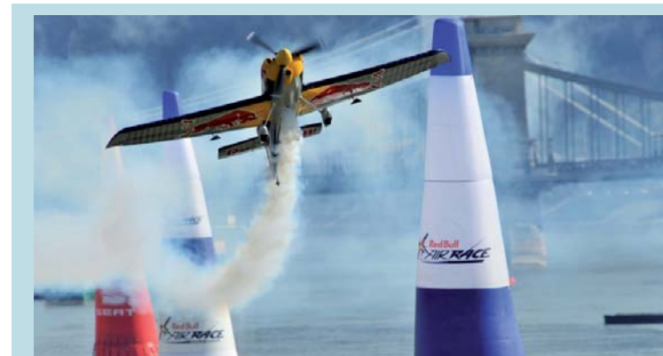
10 | Red Bull Air Race

Beim Weltcupfinale in Italien belegte das deutsche Team Platz zwei.