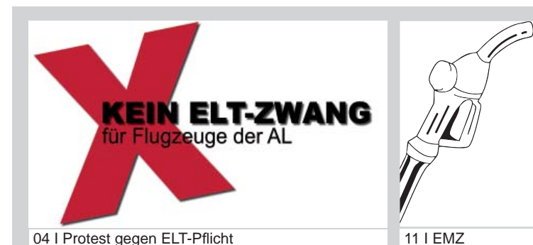
04 | Protest gegen ELT-Pflicht

Die Dopingkontrollen bei deutschen Luftsportlern waren ausnahmslos negativ.