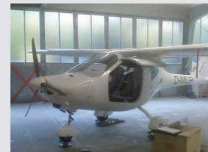
11 | Musterzulassung „Speed Cruiser“