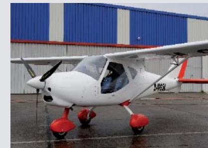
04 | Musterzulassung „MD-3 Rider“

Vom LSG-B sind 175 Luftfahrerschulen für UL-Piloten und 20 für Fallschirmspringer anerkannt. Bisher erhielten 140 aerodynamisch gesteuerte Ultraleichtflugzeuge und zwei UL-Tragschrauber die Musterzulassung. 59 Flugmodelle mit einem Gewicht zwischen 25 und 150 Kilogramm wurden mustergeprüft. 2453 aerodynamisch gesteuerte Ultraleichtflugzeuge und fünf Tragschrauber werden vom LSG-B betreut, davon erhielten im vergangenen Jahr 125 ihre Verkehrszulassung. Das Luftsportgeräte-Büro führt 13479 gültige UL-Lizenzen; im Jahr 2009 wurden insgesamt 843 neue UL-Lizenzen und 47 Fallschirm-lizenzen ausgestellt.