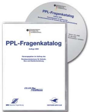
08 | PPL-Fragenkatalog

Der DAeC hat den Entwurf zur Änderung der Luftverkehrsordnung und anderer luftrechtlicher Vorschriften vom BMVBS fristgerecht kommentiert und seine Änderungswünsche eingereicht.