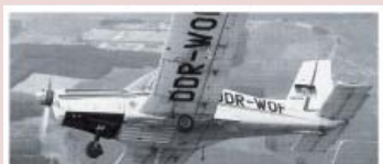
11 | 20 Jahre Mauerfall