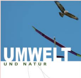
04 | Flugblätter

In der Rubrik „Termine“ unter www.daec.de sind Termine von Flugplatzfesten und Fly-ins, nationalen und internationalen Wettbewerben, Lehrgängen und Fortbildungen, Messen und Kongressen aufgeführt. Alle Veranstaltungen mit den Kontaktadressen sind mit Hilfe der Suchkriterien leicht zu finden. Der Eintrag ist für Mitgliedsvereine kostenlos.