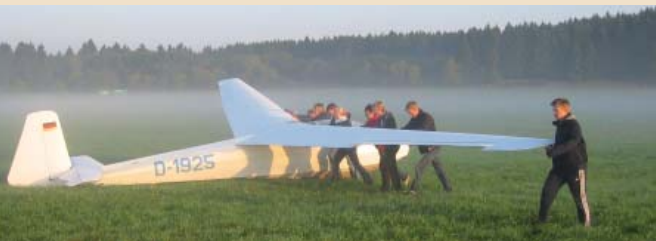
09 | Bundesjugendvergleichsfliegen