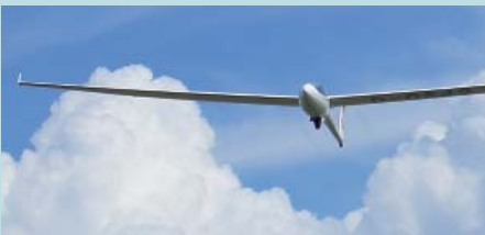
07 | Doppelsieg