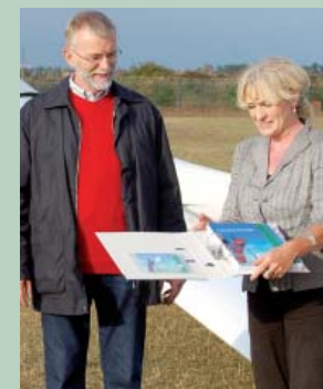
09 | Ausbildungsunterlagen