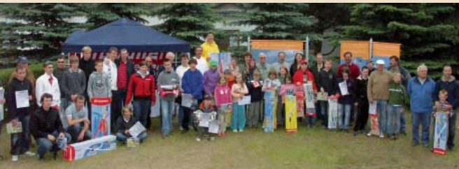
05 | UHUCup: Alle Aktiven: Insgesamt 55 Gäste, Helfer und Organisatoren